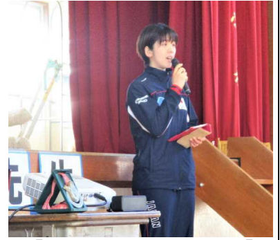
【あったかひろばコーナー】