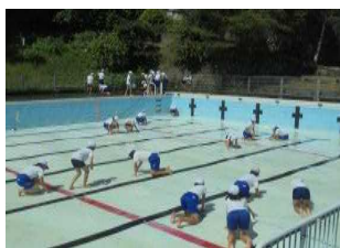
5・6年のみなさん プール掃除ありがとう。