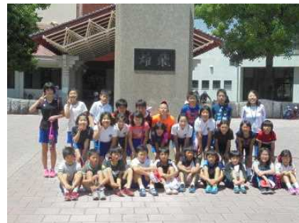
【集団宿泊学習】 (5年生)

これらの活動を通して学んだことを子どもたちが日々の学習や生活で生かすことができるよう声かけや賞賛等工夫していきたいと思えます。