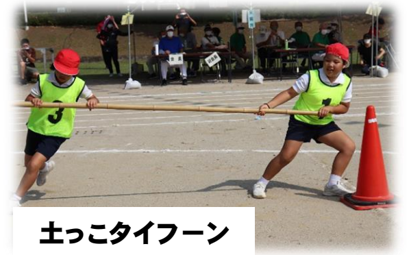
土っこタイフーン