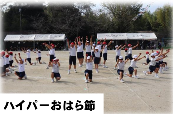
ハイパーおはら節