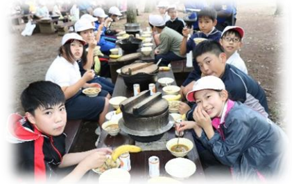
おいしく食べる様子