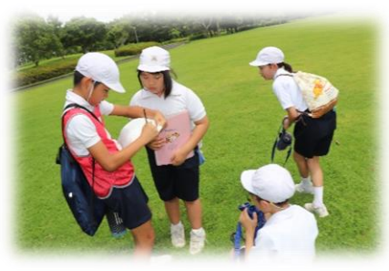
アドベンチャーラリー