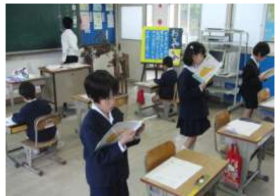
文学的文章の「読み」の授業を公開します。 (複式3・4年、複式5・6年の2学級公開)

つきましては、下記により公開研究会を開催いたしますので、貴管（校）内の先生方に多数御参加いただき、御指導・御助言を賜りますよう御案内申し上げます。