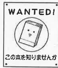
この本を知りませんが