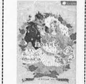
3にんのひめと王子