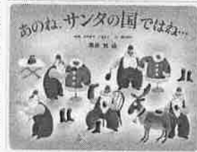
あのね、 サンタの国ではね...