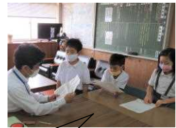
昼休み 校長先生の前で暗唱発表中

8月20日（金）に妙円寺地区公民館で「妙円寺詣りの歌暗唱大会」が行われます。学校では、7月に全校児童に暗唱カードを配付し、暗唱に取り組んできました。