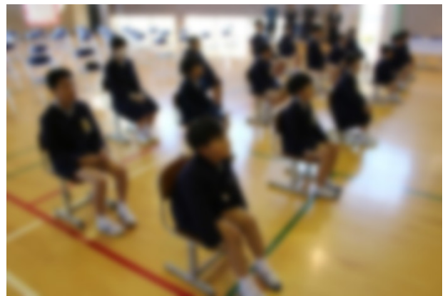
集中して話を聴く児童の様子

令和8年度定期人事異動で新しい先生4人をお迎えしました。上市来小19人の健やかな成長のために、力を合わせていきます。