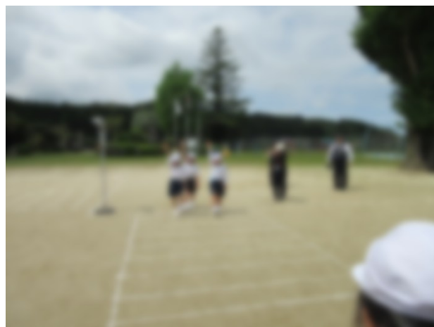
横断歩道を渡る練習(1年生)