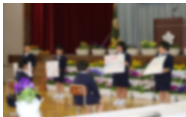
2年生による歓迎のことば