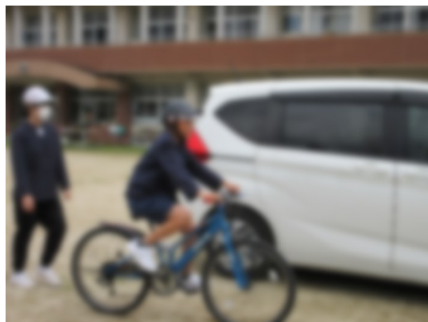
実際の道路を想定した練習