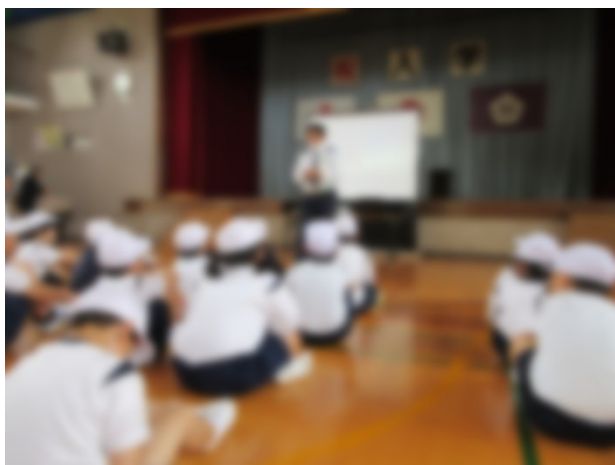
警察の方々からの話