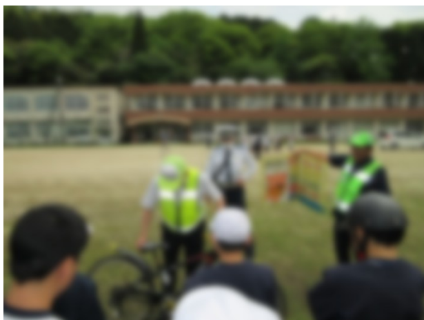
自転車点検の仕方を確認