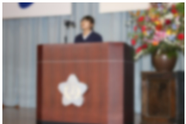
児童代表歓迎のことば