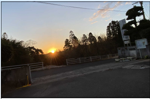
校門から望む日の出

この2023年が素晴らしい充実した1年となりますように、皆様からのより一層の御指導・御支援を賜りますようお願い申し上げます。