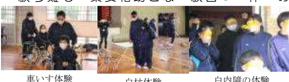
車いす体験 白杖体験 白内障の体験

社会福祉協議会の方にお越しいただき、1月19日に福祉体験学習を行いました。特殊なメガネを使った白内障の体験、白杖体験、車いす体験をさせていただきました。高齢者がどのような状態なのかを知ることができました。「助けるだけでなく、相手の方ができるような言葉かけをしていきたい」と感想を書いた生徒もおり、高齢者の困難さに寄り添う気持ち学習になりました。