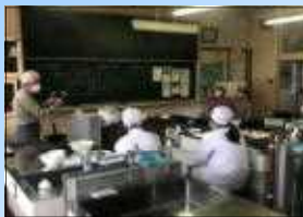
マコモダケについて

地域が育む「かごしまの教育」県民週間 今年も11月1日から11月7日まで開催します。(裏面参照)1日の文化祭などは是非お越しください。また普段の授業も御参観ください。