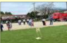
水消火器での訓練

今回は告知なしでの訓練を行いました。突然の火災報知器の作動に驚いた生徒たちも、冷静に避難することができました。初期消火についても、課題をもち、訓練になりました。しっかりと連携していききたいと思います。