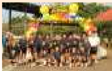
バルーンアーチの前で