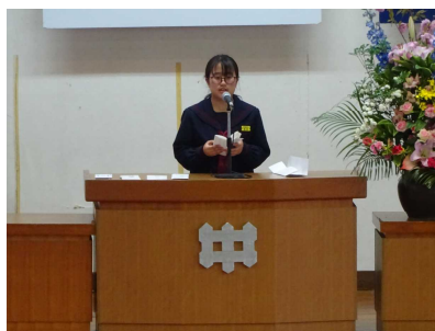
在校生歓迎のことば