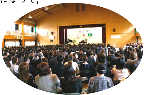
(写真) 入学式の様子

『ここがロドスだ ここで跳べ』 歌：AKB48 作詞：秋元康 長い道程(みちのり)を走り抜け やっと山の麓まで来た 夜明け 前にそびえ立つその夢は 雲がかかる頂に似ている