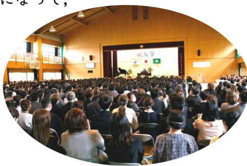
(写真) 入学式の様子