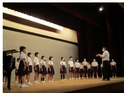
6年生「つばさをください」

大変御多用な中、多くの保護者の皆様にお越しいただき、盛会のうちに合唱コンクールを終えることができました。御来場、誠にありがとうございました。