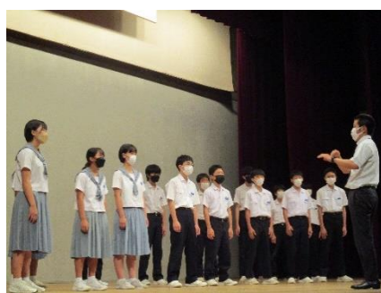
9年生「変わらない想い」