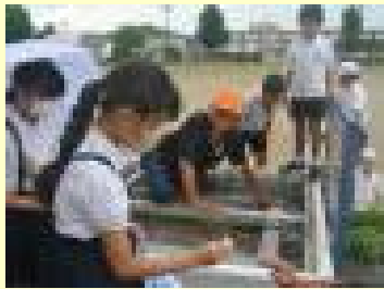
【ウミガメの卵の保護】

7月27日（日）～8月2日（土）のうちの5日間、伊作小PTAを主体としたかめパトロールを実施しました。入来浜を月明り、星明りをたよりに午後8時（2回）午後9時（3回）から1時間程度パトロールを行いました。ウミガメがびっくりしないように、「走らない」「明かりをつけない」「大声を出さない」ことに気をつけながパトロールをしましたが、今年度は残念ながら伊作小のかめパトロールでは卵を保護することができませんでした。しかし、地域の有志の方々のかめパトロールにより345個の卵を保護していただき、伊作小のふ化場に移しました。来年度もカメパトロールを実施します。たくさんの方の参加をお待ちしております。