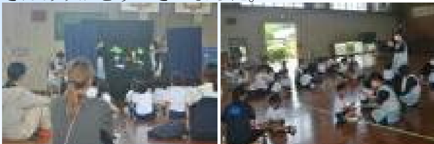
【読み聞かせの様子】

6月20日(金)、ぽけっとファンタジーの3名の先生を講師に招き、1年生とその保護者を対象とした家庭教育学級「読み聞かせ」を実施しました。「たなばたバス」「どうぶつのはんこちゃん」「はずかしがりやのれんこんくん」「エパピナンドス」の読み聞かせがありました。子どもたちは、目を輝かせて楽しそうに読み聞かせを聞いていました。途中、親子で交流する場面もあり、充実した時間になりました。ぽけっとファンタジーの皆さんありがとうございました。