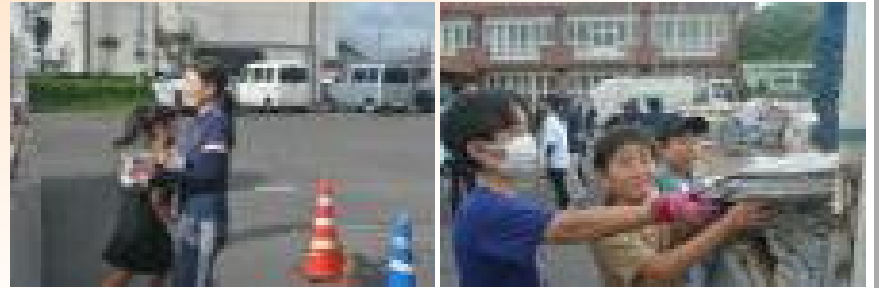
【P T A資源回収の様子】

6月22日(日)のP T A資源回収では、たくさんの保護者の皆様の御協力、誠にありがとうございました。収益金は、今後の充実した伊作小学校P T A活動運営のために活用させていただきます。また、P T A資源回収班の皆様のおかげで、前日までの準備から当日の運営まで安全かつスムーズに実施することができました。重ねてお礼申し上げます。