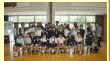
【特別支援学級の入学・進級を祝う会】

子どもたちは、今年一年の抱負や好きなことを、先生方や保護者の前で一人一人発表しました。それぞれのめあてに向かって共に頑張ろうと、決意を新たにしていました。