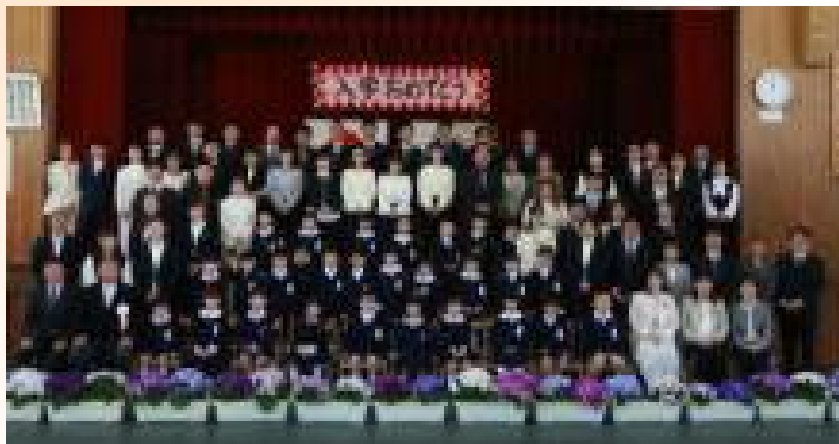
【入学式での集合写真】

その後、入学式を行いました。真新しい制服を身に付けた28名の新一年生が式に臨みました。最初は緊張した面持ちでしたが、音楽とともに元気よく入場してきました。子どもたちは、自分の名前を呼ばれたら大きな声で返事をしたり、お祝いの言葉に「ありがとうございます」と答えたりしていました。これからの成長がとても楽しみです。