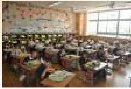
【初めての給食の様子】

4月14日(月)、1年生の小学校生活で初めての給食がありました。むぎごはん、わかめスープ、やきにくいため、牛乳をおいしそうに食べていました。これからも好き嫌いなくたくさん食べて大きく成長してほしいです。