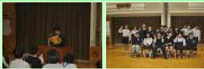
【特別支援学級卒業・修了を祝う会の様子】

3月6日（金）特別支援学級の卒業・修了を祝う会を日新ホールで行いました。子どもたちは、それぞれにもって来たためあてに沿って一年間がんばってきたことや楽しかったことなどをしっかりと発表していました。一年間の成長を感じることができた素晴らしい会になりました。