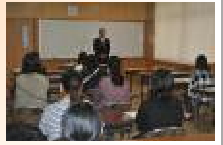
【家庭教育学級の様子】

2月27日(金)今年度最後の学級PTAがありました。各学級担任から子どもたちの1年間の成長や学級経営の反省等の話がありました。また、家庭教育学級の閉級式もありました。年5回(開級式・読み聞かせ・人権教育・親子ふれ合い体操・閉級式)の家庭教育学級でしたが、家庭教育の充実に向けた活動等を御提供できたのではと思います。たくさんの保護者の皆様の御参加ありがとうございました。