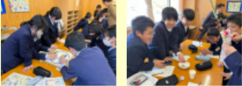
【吹上高校出前授業の様子】

2月18日(水)吹上高校の先生方による出前授業がありました。手回し発電機を利用した釣りゲームで発電の仕組みを学んだり、モーターを使った相撲ロボットで遊んだりと楽しく学習することができました。専門的な知識をもつ先生方による授業を通して、理科の楽しさを学ぶことができた充実した学習になりました。吹上高校の先生方本当にありがとうございました。