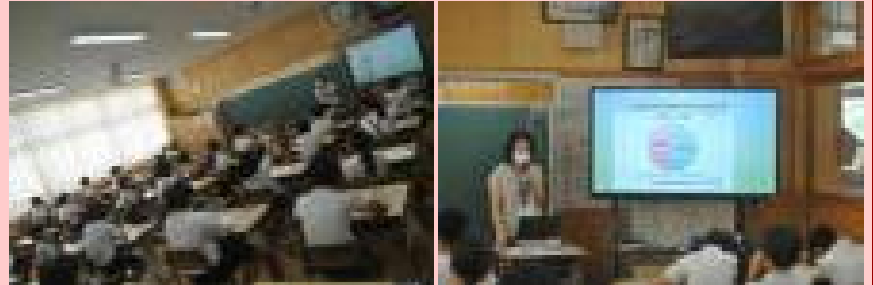
【SOSの出し方教室の様子】

10月3日（金）スクールカウンセラーの先生を講師にお招きして、5年生の子どもたちが「SOSの出し方」について学習をしました。一人一人がとても大切な存在であることを確認し、自分をストレスから守る方法「大声を出す」「好きなことをする」「甘いものを食べる」等や悩みが大きくなってしまったら、誰でも近くの人に知らせることを知りました。また、友達が困っていたら、そっと聞いてあげることも大切だと学びました。