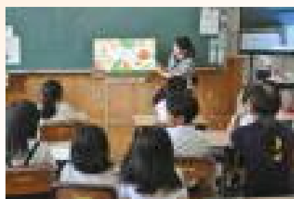
【保護者による読み聞かせ】