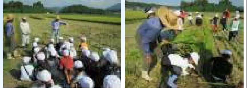
【稲刈り体験の様子】

10月7日（火）さん、さん、さんを講師に3年生が稲刈り体験を行いました。初めて稲刈りをする子どももいましたが、前日の練習の成果もあり、鎌の使い方がどんどん上手になりました。子どもたちにとって、貴重な勤労体験になりました。子どもたちからは、「だんだん上手になってうれしかった」や「早くお米（ヒノヒカリ）を見たい」などの感想がありました。このような体験の機会を与えてくださった今田水田保全協議会の皆様に感謝いたします。