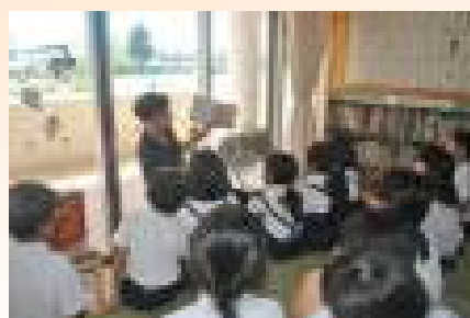
【先生の読み聞かせ】