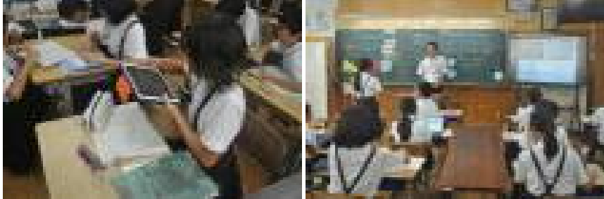
【「学習者主体の授業」の様子】

9月22日（月）子どもの姿から授業を振り返り、学力向上へとつなげていくことをねらいとした「学習者主体の授業」の研究授業がありました。5年生の子どもたちは、たくさんの先生方に緊張していましたが、五角形の内角の和を求める方法や資料を自分で選択しながら一生懸命がんばっていました。自分の考えを筋道を立てて説明している姿に「さすが高学年だな」と感心しました。今後も「ICTの効果的な活用を通して、確かな学力を身に付け、主体的に学び続ける児童の育成」に向けて学校でも取り組んでいきます。御家庭におかれましても、家庭学習の充実に向けて御協力をよろしくお願いいたします。