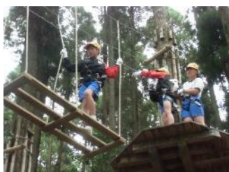
【フォレスト・アドベンチャー】