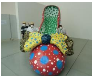
【霧島アートの森にて】