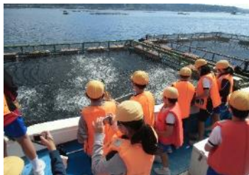
【魚への餌やり体験】

6年生が、10月20・21日に修学旅行に行きました。当初は、熊本方面へ行く予定にしていた修学旅行ですが、新型コロナの影響で、目的地を鹿児島県内に変更して実施しました。県内旅行でしたが、子供たちは旅行の中で鹿児島の良さを発見したり友達との絆を深めたりしていました。