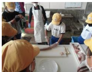
【魚のさばき方体験】