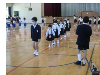
クイズをしたりメダルをもらったり楽しい会になりました。