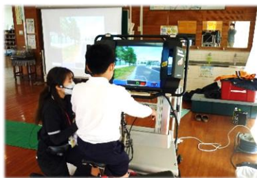
安全運転に気を付けて！