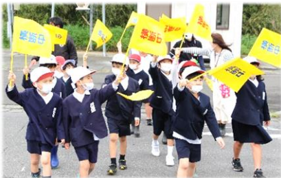
花熟里交差点で実践！

前日からの雨で室内中心の「交通安全教室」を行いました。1・2年生は道路の歩き方を確認した後、花熟里交差点での歩行実地練習を、3～6年生はシミュレーションマシンで自転車の乗り方の学習をしました。今後も十分注意をし、交通事故に気を付けましょう。