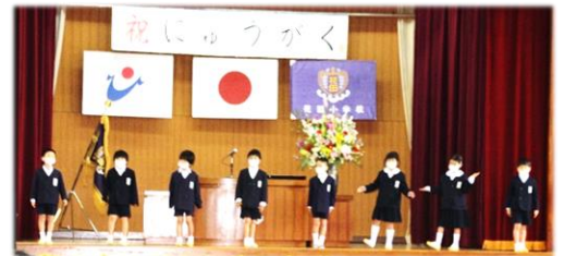
2年生の歓迎のことばと歌