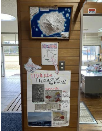
職員室廊下にある 「桜島コーナー」

2023年を表す漢字について、ある会社が全国の小中高生にアンケートしたところ、1位は「楽」だったそうです。新型コロナウイルスが5類へ移行し、これまで制限されていたことができるようになったことが理由のようでした。ちなみに2位は「推」、3位は「恋」と明るいイメージの漢字でした。この流れが2024年も続いて欲しいと思っていた矢先、元日の夕方、震度7という大きな地震が能登半島で起きました。「どうして元日に」と思われた方も、多かったのではないのでしょうか。特に今年は家族・親戚が集まって賑やかな元日を迎えられた御家庭が多かったと思います。そんな中に地震が発生し、その様子が刻々とテレビに映し出され、当事者の方々はもちろんですが、映像を見ている側の衝撃も大きかったと思います。未だに被害がどれだけのものか把握しきれていない状況、安否不明の方もいらっしゃるという状況にその被害の深刻さを感じます。鹿児島も南海トラフ地震や桜島の大噴火と災害のリスクが高まっている中にあります。いつ起こりうるかわからない中で、何ができるのか…。