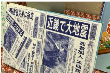
階段図書コーナーでの紹介

2023年を表す漢字について、ある会社が全国の小中高生にアンケートしたところ、1位は「楽」だったそうです。新型コロナウイルスが5類へ移行し、これまで制限されていたことができるようになったことが理由のようでした。ちなみに2位は「推」、3位は「恋」と明るいイメージの漢字でした。この流れが2024年も続いて欲しいと思っていた矢先、元日の夕方、震度7という大きな地震が能登半島で起きました。「どうして元日に」と思われた方も、多かったのではないのでしょうか。特に今年は家族・親戚が集まって賑やかな元日を迎えられた御家庭が多かったと思います。そんな中に地震が発生し、その様子が刻々とテレビに映し出され、当事者の方々はもちろんですが、映像を見ている側の衝撃も大きかったと思います。未だに被害がどれだけのものか把握しきれていない状況、安否不明の方もいらっしゃるという状況にその被害の深刻さを感じます。鹿児島も南海トラフ地震や桜島の大噴火と災害のリスクが高まっている中にあります。いつ起こりうるかわからない中で、何ができるのか…。