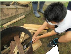
空気が入るように小枝や少し細目の薪を酌まない大きな薪には火は付かないな。

端午の節句の食べ物と言えば、鹿児島では「あくまき」です。この「あくまき」には先人の知恵が詰まっています。理科の視点からいくと、アルカリ性の灰汁と竹皮には防腐剤の働きがあり、食品を長持ちさせてくれます。かまどで薪に火を付ける作業にはやっぱり理科の知識も必要です。「あくまき」を完成させるまでには、作業工程を工夫する必要があります。これはプログラミング教育。もち米を量り、竹皮に包み紐で結ぶ作業は算数と家庭科。このようにあくまき作りには、教科書で学ぶ要素が多く含まれています。そこで、5年生に、「あくまき」づくりに挑戦してもらいました。