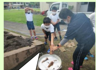
もち米が粘化するには沸騰してから1時間。けっこう時間がかかるな。

「あくまき」作り初体験の子どもたちにとって1番難しかったのは火おこしだったようです。また、結ぶためのひもを竹皮の両端から取れば良いという知恵など勉強になったようでした。今、教科書で学んだ知識が、実は生活に密接していることを実感させることが重要視されています。これからも教科書での学びを体験に生かす活動に取り組んでいきます。