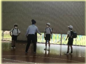
5・6年生による声かけ想定訓練

登下校中に不審者にでくわした時に自分の命を守るために、真剣に話を聞き訓練をしました。防犯ベルが鳴るのかも確認してください。