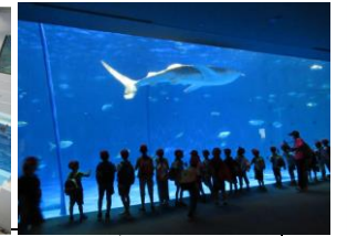
ジンベイザメに大興奮