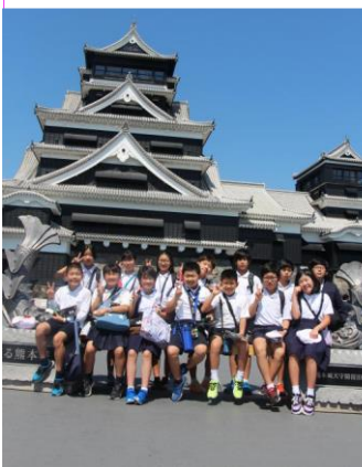
熊本城での記念写真

先人の知恵と言えば、5月17日からの1泊2日の修学旅行で、5・6年生は熊本地震で被災した熊本城の再建から見て城や石垣の造りに難攻不落と言われた名城の知恵を学んだようでした。