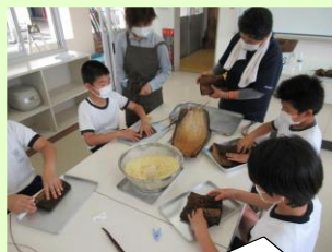
竹皮を三等分にして、2カップのもち米を入れる。竹皮のひもって結びづらいな。