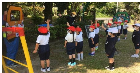
手を挙げて 左右確認しながら