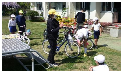
自転車点検の「ブタはしゃべル」