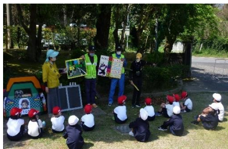
1・2年横断歩道の渡り方「はひふへほ」

学校では「命を守る学習」の1つである「交通安全教室」で1・2年生は花熟里交差点での歩行、3～6年生は自転車の乗り方の学習をしました。子どもたちの通学路は国道270号線沿いなので、今後も十分注意をし、交通事故に気を付けましょう。