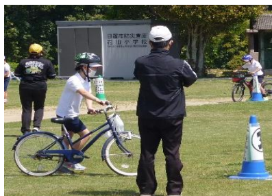
3～6年 自転車の乗り方