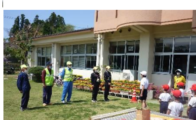
ご協力いただいた方々にお礼