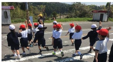
花熟里交差点で実践！