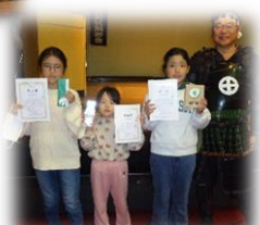
3名が賞をいただきました