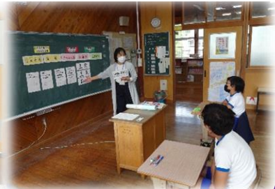
5・6年生の授業より