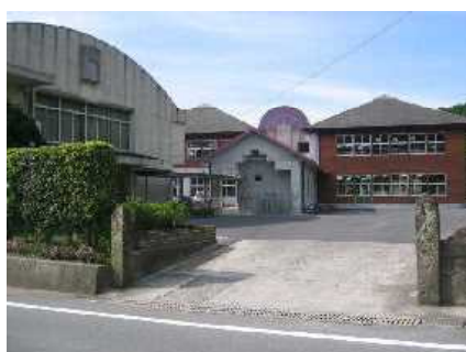
通用門より体育館