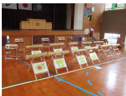
ひまわり竹太鼓(体育館)