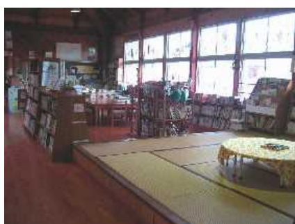
図書閲覧スペース