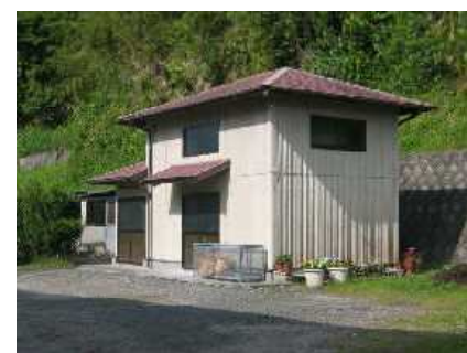
体育倉庫・農具倉庫