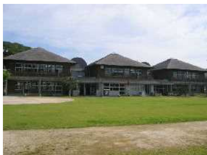
校庭より校舎全景