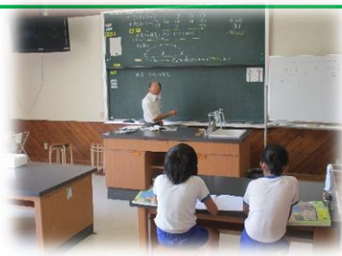
3・4年生の理科の授業です