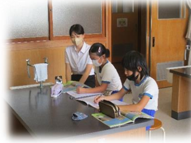
3・4年生の理科の様子です