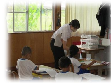
1・2年生の算数の様子です

4年生は、家庭で月の観察をするために、観察の仕方について学習しました。自分の家の近くの目印をスケッチし、事前準備をしました。