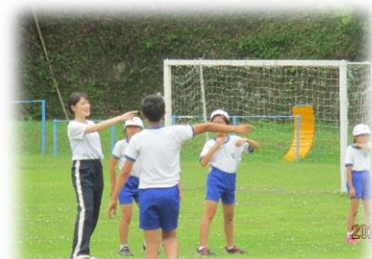
昼休みにみんなで鬼ごっこをしている様子です