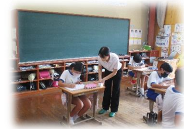
5・6年生の図工の様子です