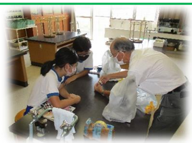
5・6年生の理科の授業です